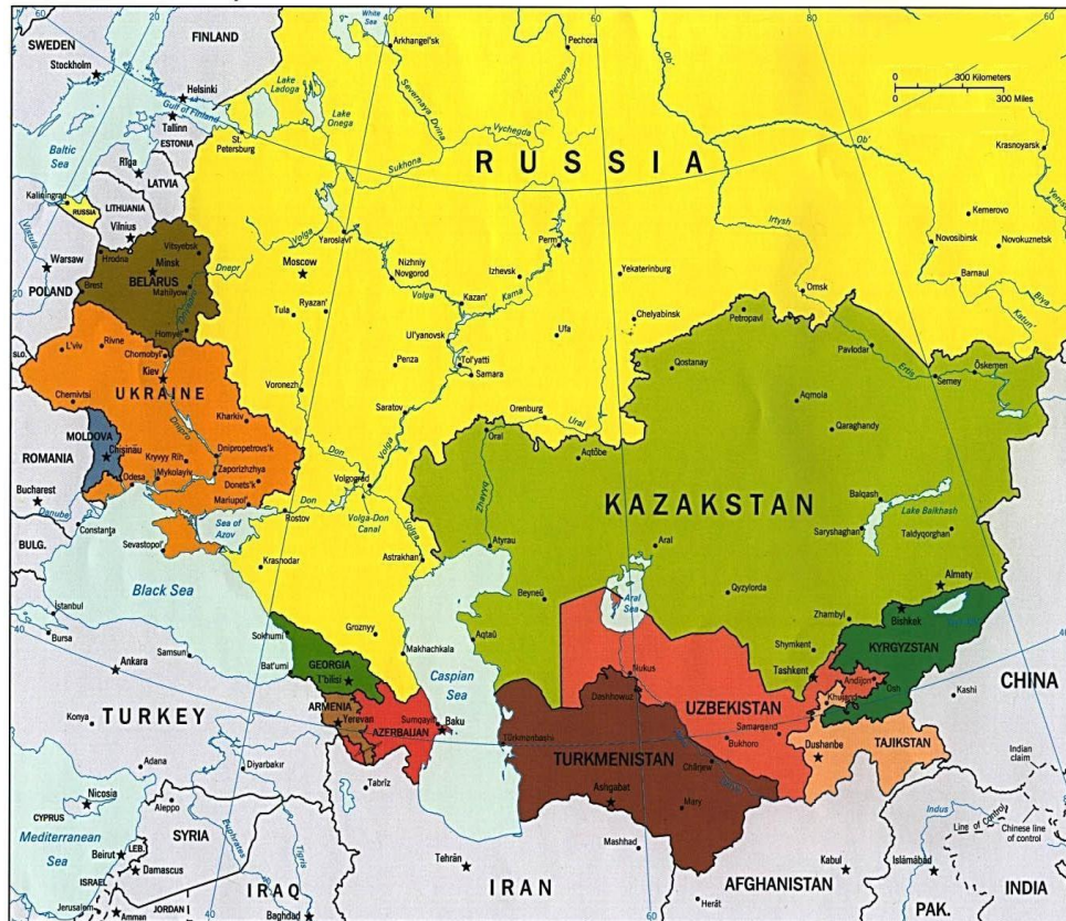
Commonwealth of Independent States

Інформаційна довідка. СНД – це спільний географічний простір, що включає в себе 11 країн, де проживає біля 260 млн. населення.